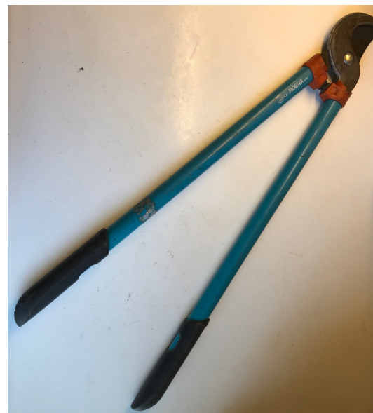
Takkenschaar - takken verkleinen