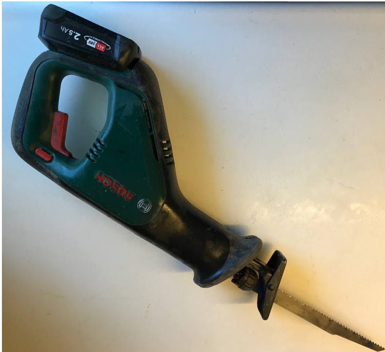
Reciproke zaag (voor de ervaren klusser)