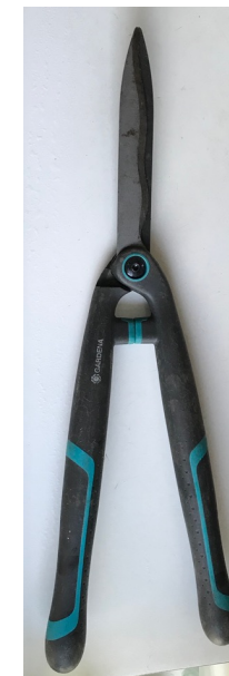
Heggenschaar - heggen