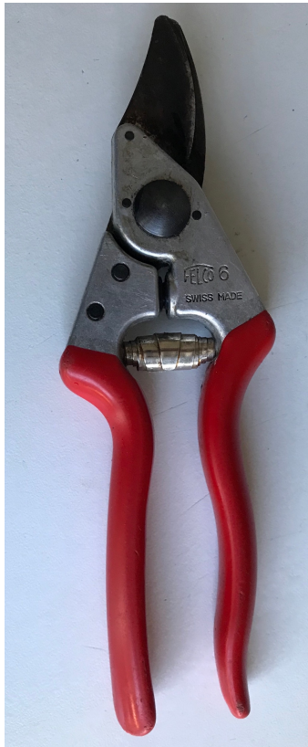
Voor dunne twijgen