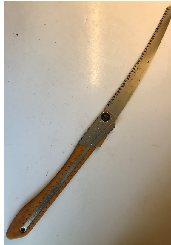
Voor dikke takken